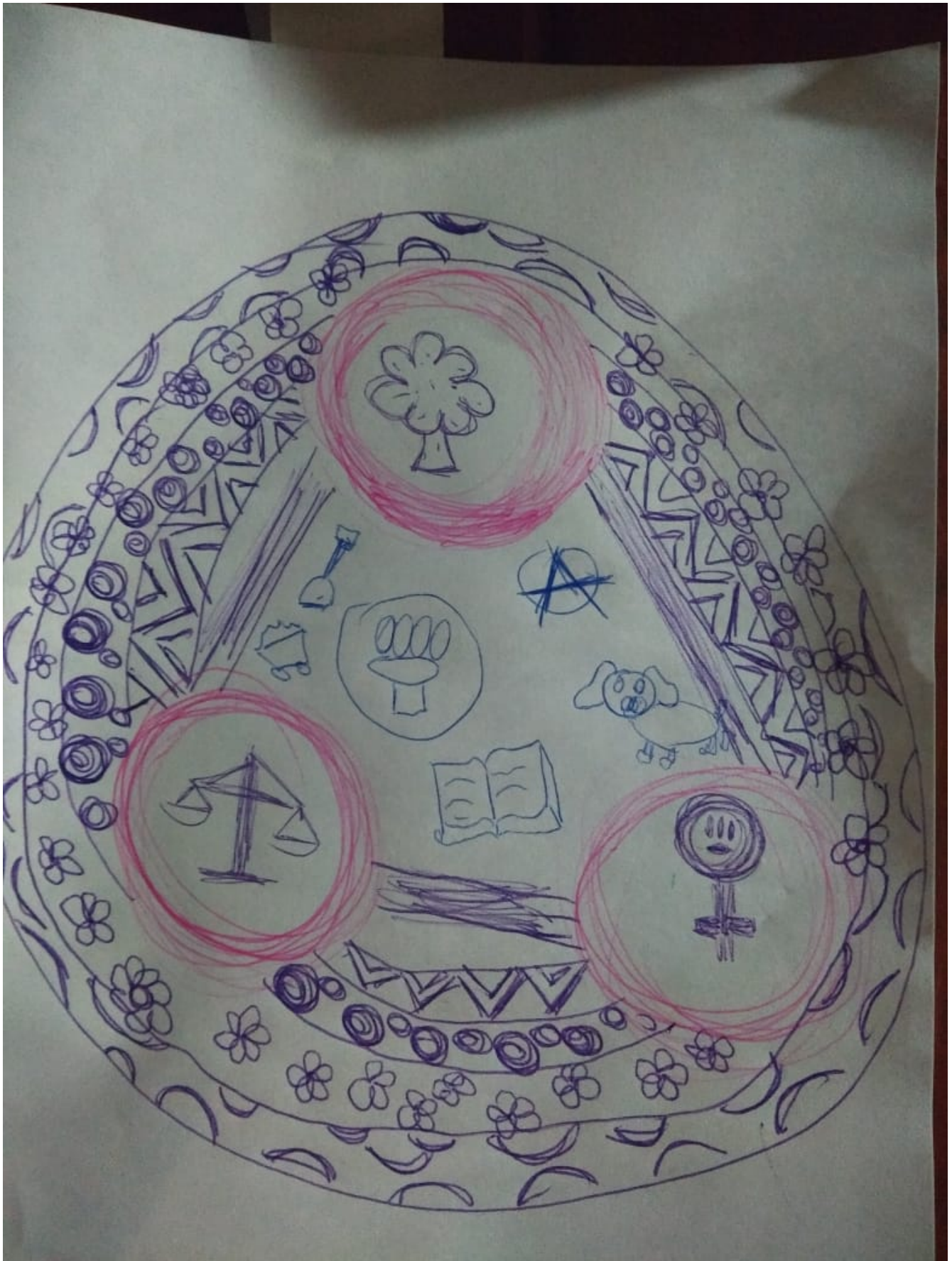
Trabajo de identificación. Quiénes somos, qué nos identifica,