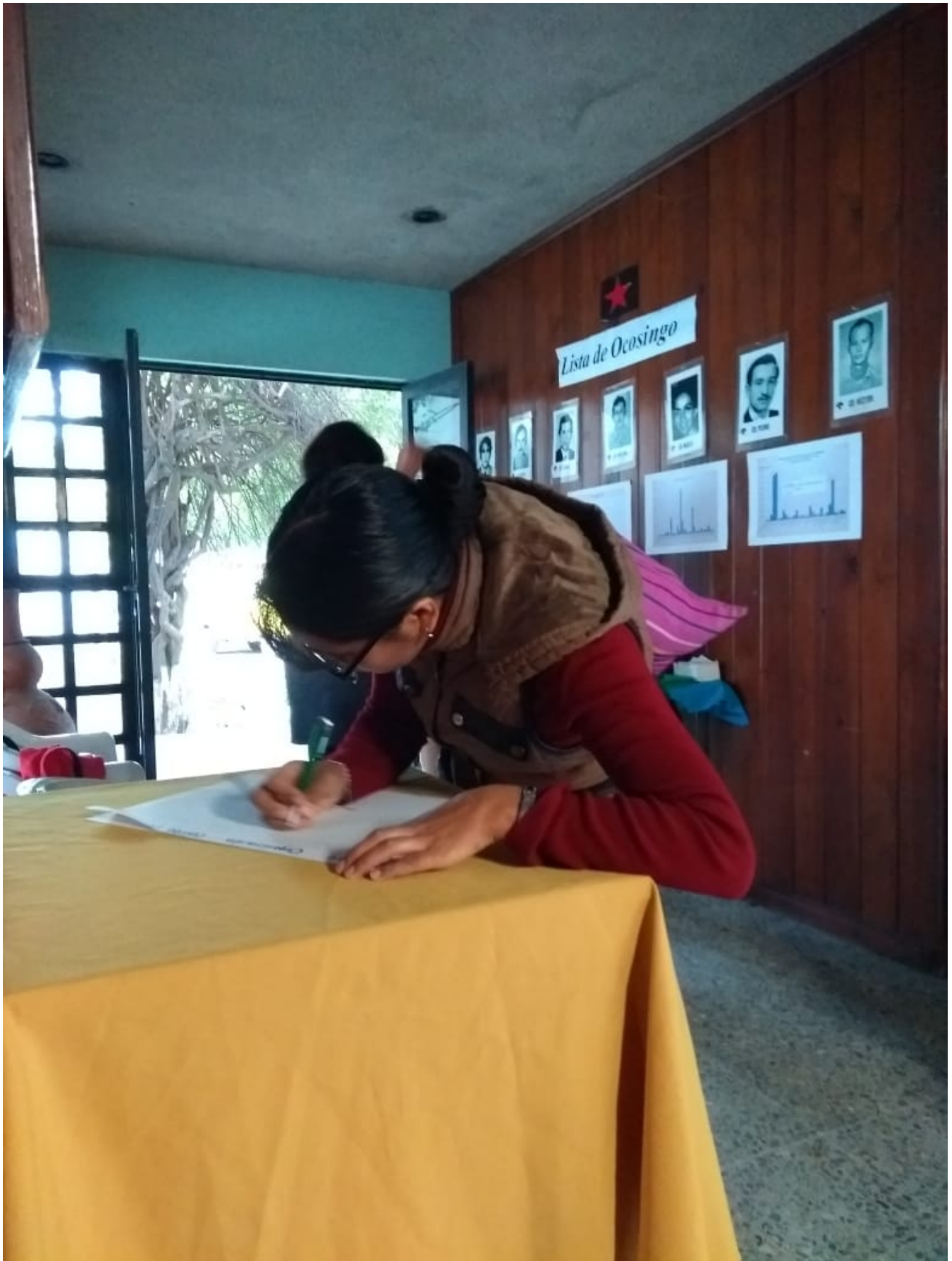
Registro de compañeras al encuentro.