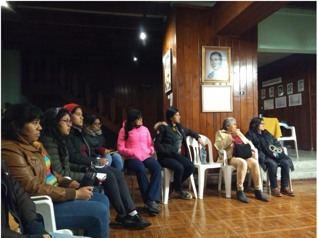
Plenaria de discusión en sala de banderas de la Casa de todas y todos.