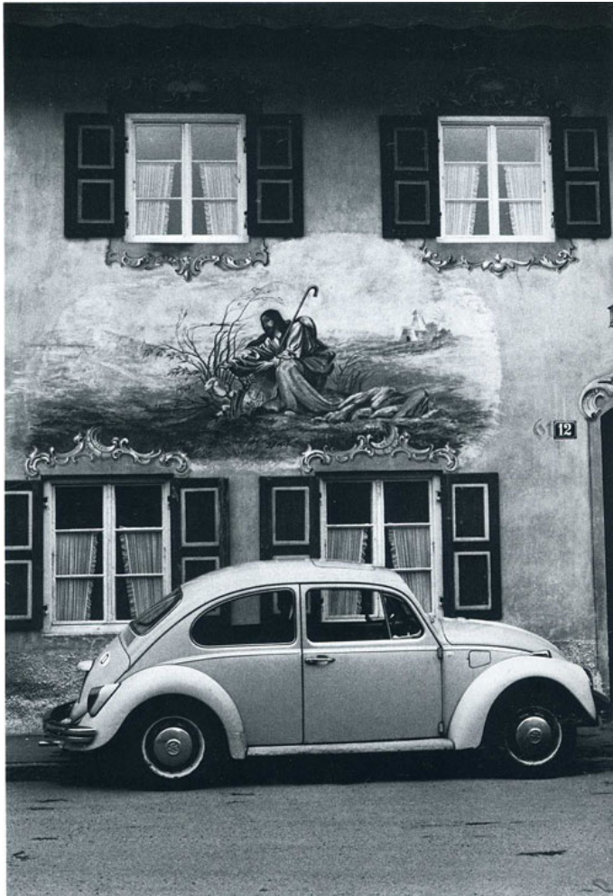
Eisenstaedt- Volkswagen, Mittenwald, Marzo 1980.

Ha sido esa Europa gris de los banqueros y de los “civilizadores” a cañonazos, no lo olvidemos, la que constituyó el escenario en el que desde 1989 y la derrota del llamado “socialismo real”, se fueron asentando las condiciones para la formación del paisaje histórico del presente: la irrupción del capitalismo financiarizado y la crisis de la segunda década del siglo; las políticas de austeridad forzosa y la erosión de derechos políticos; el auge de la extrema derecha en el continente; la explotación política del miedo a gran escala con la inestimable ayuda ahora del yihadismo ultrarreaccionario. Lo que significa , en fin, el nuevo progreso de la “barbarie”.