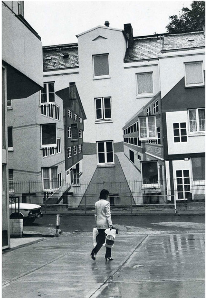
Eisenstaedt – Posseldörf, Hamburgo, 1979

afirmaciones que con pasmosa tranquilidad realizaban dirigentes políticos de la época, y no solo los cabecillas fascistas. Podemos recordar también a un supuesto demócrata y prohombre liberal como el primer ministro británico Lloyd George comparando a los polacos de Danzig con “chimpancés” en una de las sesiones del Tratado de Versalles en 1918.