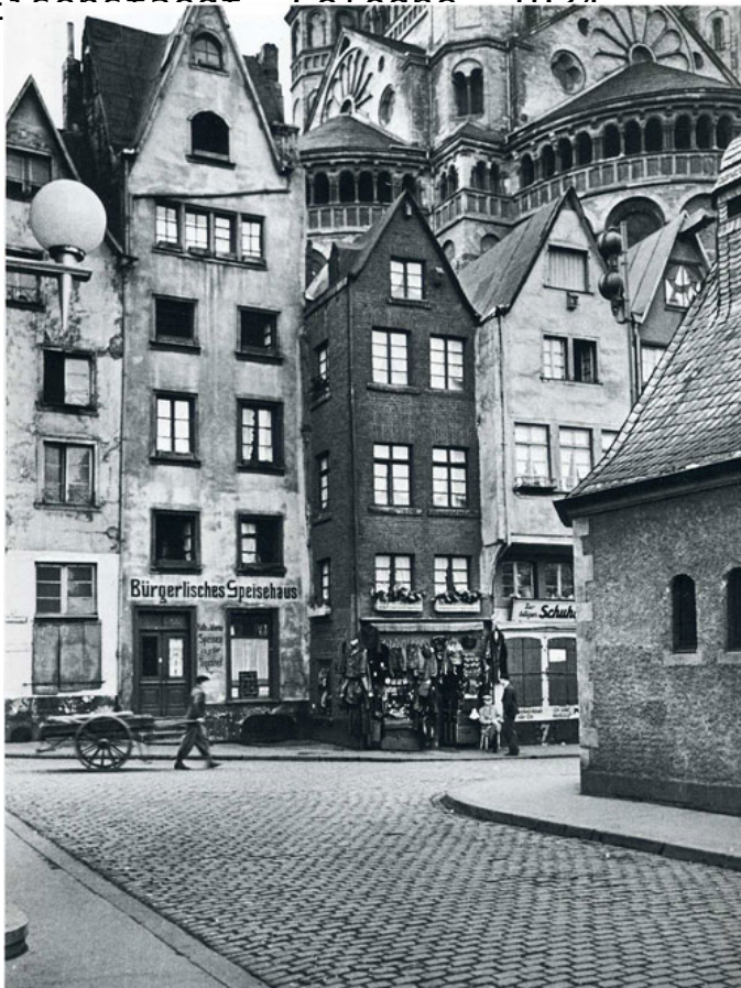
Colono, 1924

Para el historiador italiano Benedetto Croce, el fascismo que asoló Europa desde los años 20 hasta 1945 fue simplemente “un mal sueño” un terrible paréntesis en la historia de la civilización. Tal experiencia constituía para Croce una excepción trágica en la progresiva victoria de la civilización contra la barbarie. Algo que no se repetiría jamás. Sin duda Croce, que fue un honesto antifascista, fue también un idealista entusiasta del “progreso” y de la “civilización occidental”. En su “historicismo absoluto” no cabía sino la victoria final de la libertad y de la civilización frente a la barbarie que representaba el fascismo. Triunfo que aparecía resplandeciente tras la caída del Berlín nazi en 1945.