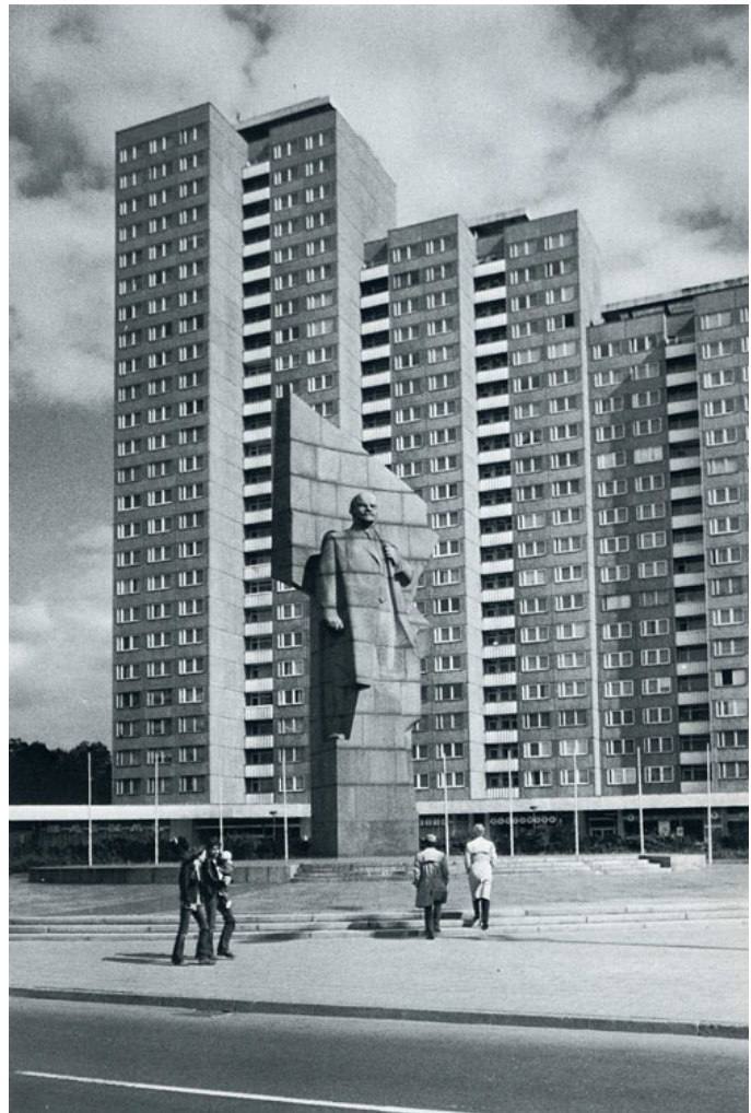
Eisenstaedt- Leninplatz, Berlin del Este, 1979

Moderna, empezando por ese periodo que se denomina la “Era de los descubrimientos geográficos, siglos XV y XVI” título que esconde con bondadosa licencia escribana lo que se debería denominar en realidad como la “era de la brutal expansión del capital mercantil allende la mar oceana”.