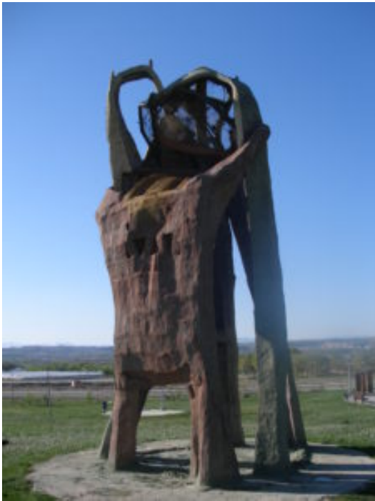
Escultura de Joxe Ulibarrena, titulada "Los acribillados en la Santa Cruzada", dentro del Memorial.

Este primero de mayo recordamos a quienes entregaron su vida por el ideal de un mundo sin clases, sin estamentos, sin razas. A quienes lucharon por un mundo sin explotación y sin despojo. Aquellos cuyas luchas nos hacen recordar que el capitalismo es la lógica de reducir al hombre trabajador a un mero animal. La causa de la libertad de los pueblos triunfará, más temprano que tarde.