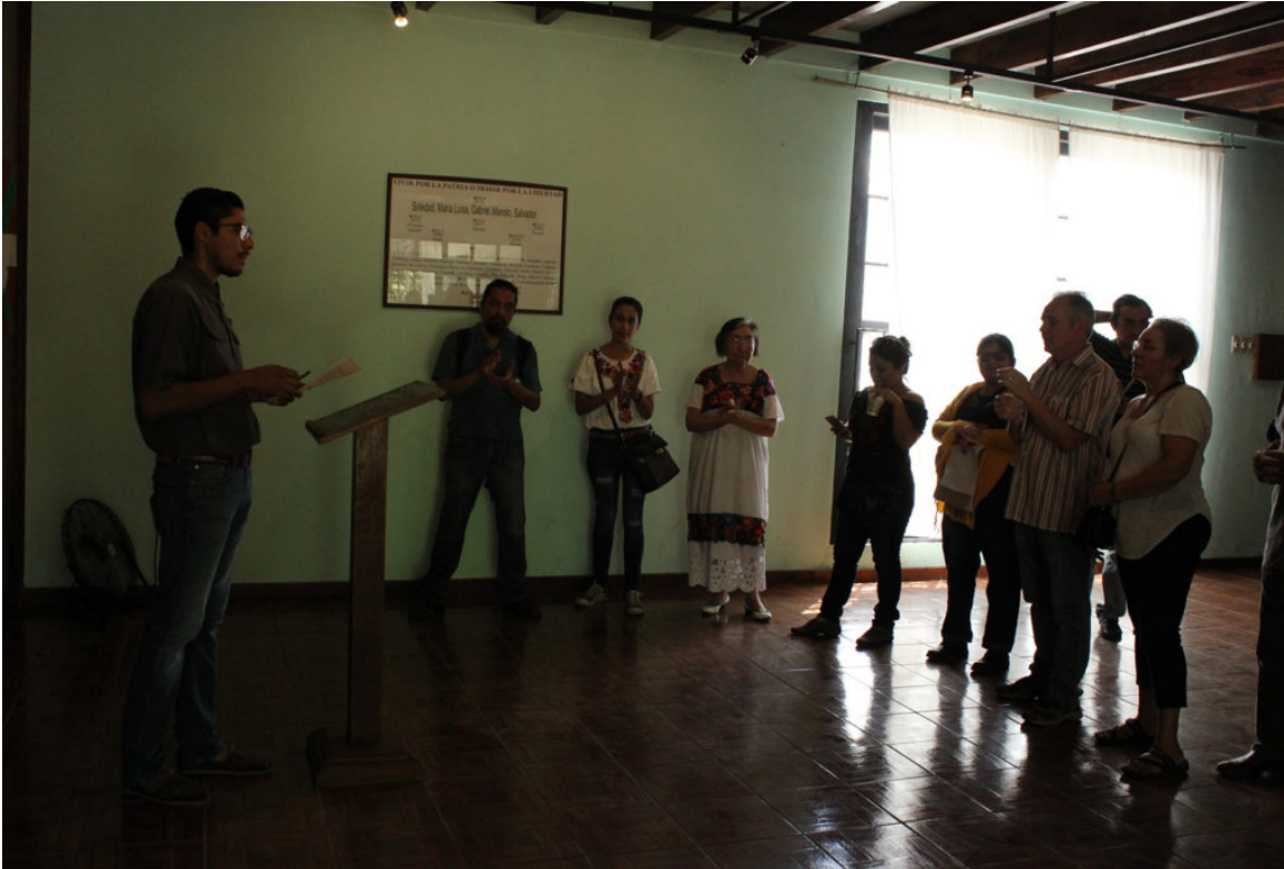
Salón de actos Fray Servando Teresa de Mier-Francisco Xavier Mina. Casa de Todas y Todos.

llevar a cabo las labores de búsqueda de los compañeros desaparecidos en 1974 en la Laguna del Ocotal, Chiapas.