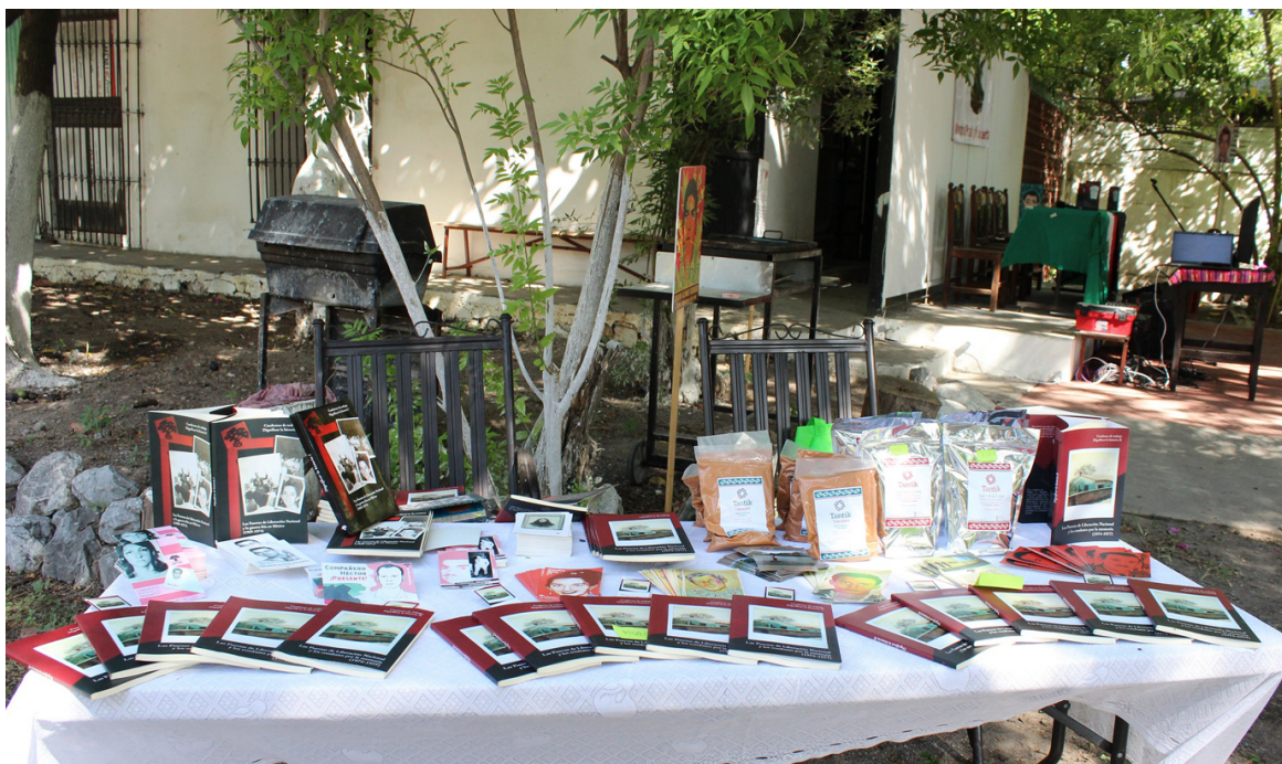
Cuadernos de trabajo. Dignificar la Historia II. Las FLN. Casa de Todas y Todos. (2016)

cual se ha violado y transgredido – y sigue haciéndolo – los derechos del pueblo, logrando la opacidad de la realidad gracias a la complicidad de los medios de comunicación; el estigmatizar a las y los luchadores sociales en Latinoamérica y a los integrantes de las Fuerzas de Liberación Nacional, quienes conociendo su realidad prefirieron el anonimato frente al protagonismo. Reconoció la importancia de hacer públicos los documentos de primera mano para dimensionar la ética y ca congruente práctica de las y los compañeros de las Fuerzas de Liberación Nacional.