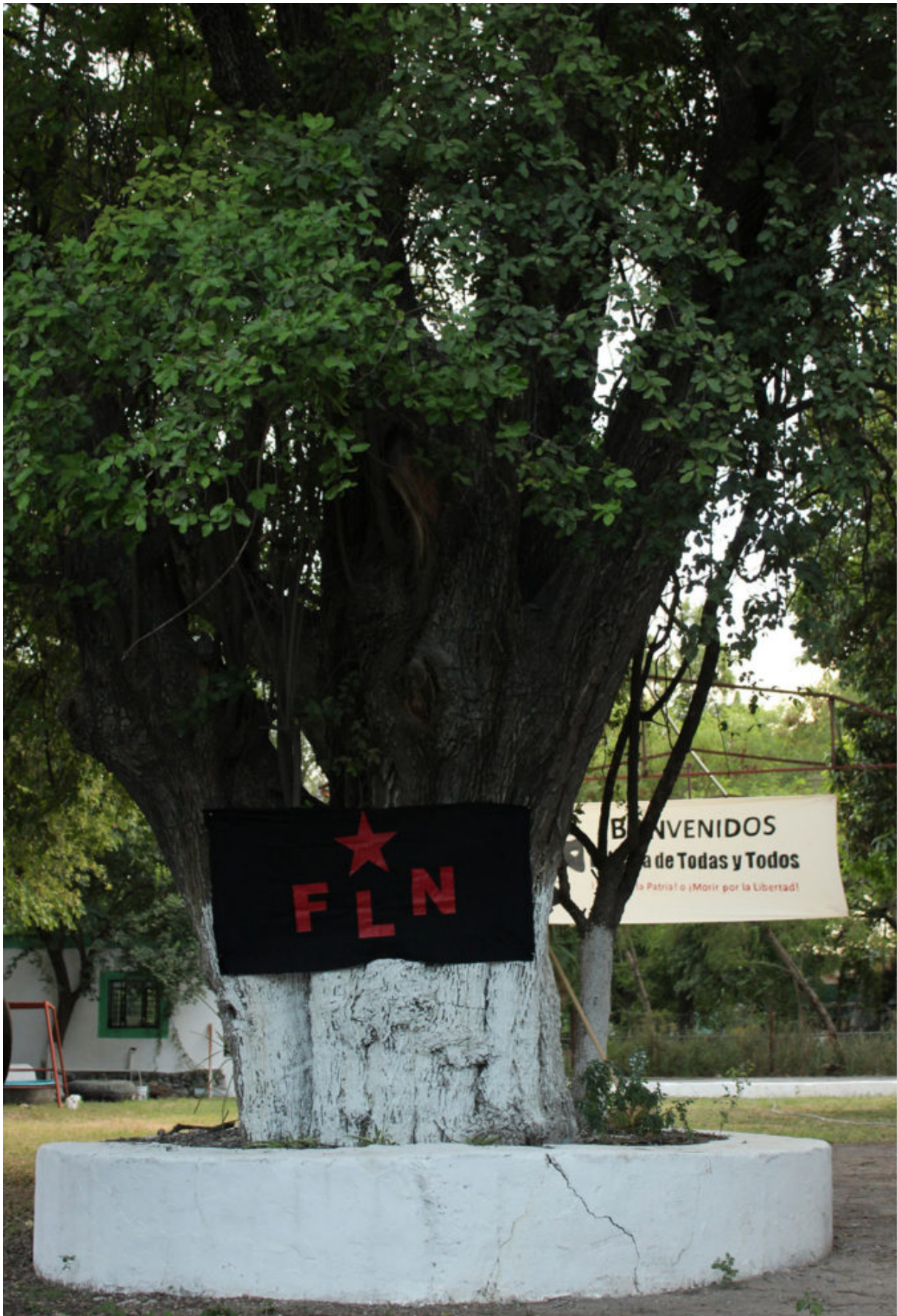
Patio de la Casa de Todas y Todos. Monterrey, NL. (2016)